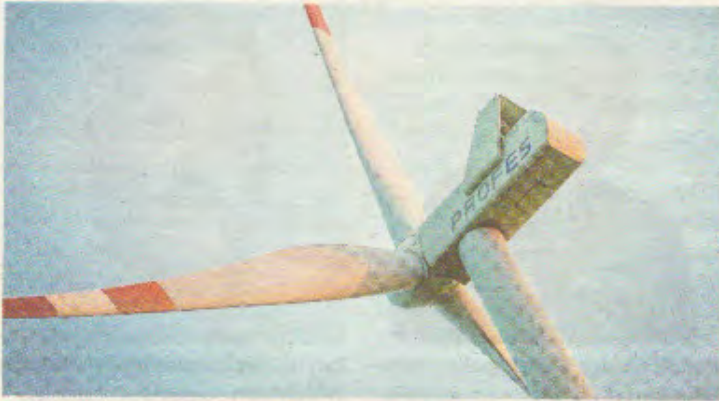
Sechs Windräder des Modells V126 mit einer Gesamthöhe von 202 Metern möchte die Firma PROFES in der Gemeinde Sallingberg bauen.

von der Interessengemeinschaft Windkraft Österreich (IGW) hat sich der Windkraftausbau in Niederösterreich in den letzten Jahren deutlich verlangsamt: „Statt einer beschleunigten Energiewende ist der Nettoausbau bei der Windkraft in den letzten Jahren auf ein Viertel eingebrochen.“